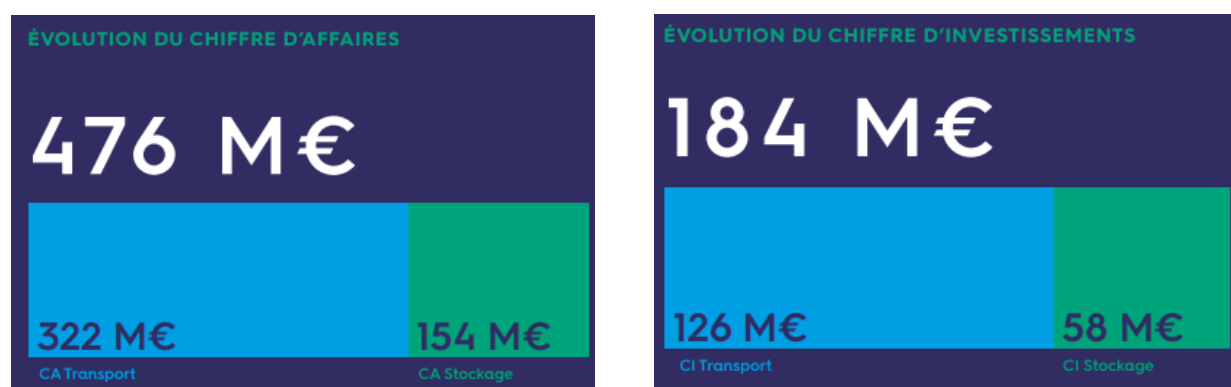
Figure 2: Chiffre d'affaires et investissements pour l'année 2018

Teréga est une société anonyme dont le capital s'élève à 17 579 088 €. En 2018, Teréga a réalisé un chiffre d'affaires d'environ 476 M€.