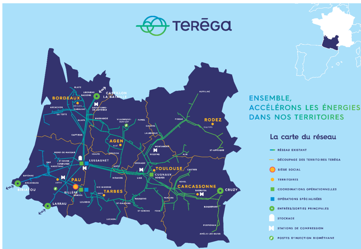
Figure 1 : Carte du réseau de Transport de Teréga